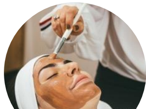
THALASSO, THERMES & SPA